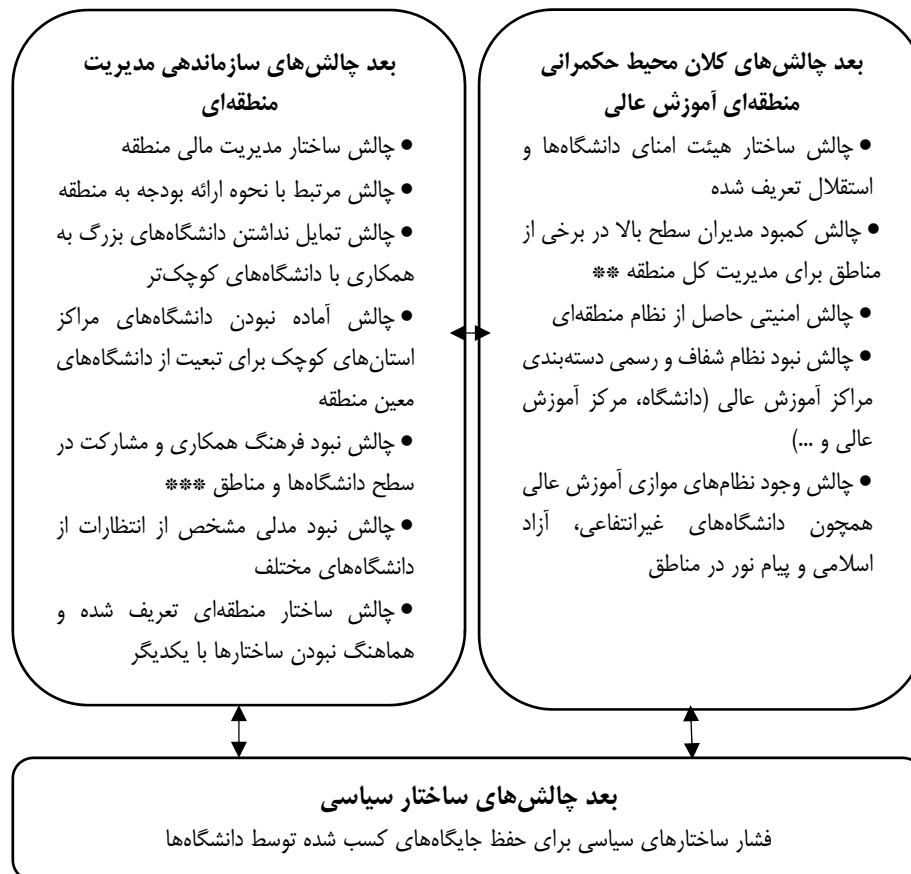
شکل ۳- الگوی نهایی چالش‌های پیاده‌سازی مدیریت منطقه‌ای آموزش عالی

در بعد چالش‌های سازماندهی مدیریت منطقه‌ای به سه محور اصلی پرداخته شده است. محور اصلی تعاملات میان دانشگاه‌های بزرگ و کوچک است که در ساختار منطقه‌ای آموزش عالی امری اجتناب‌ناپذیر است. سه چالش نبود تعامل میان دانشگاه‌های کوچک با بزرگ، تمایل نداشتن دانشگاه‌های بزرگ به پذیرفتن مسئولیت دانشگاه‌های کوچک و نبود فرهنگ مشارکتی یکی از محورهای اصلی چالش‌های این بعد به‌شمار می‌رود. تجربه‌های ملی و شواهد در کنار همدیگر مؤید این چالش هستند. دانشگاه‌های کوچک نگران محدود شدن اختیارات خود و دانشگاه‌های بزرگ نگران افزایش امور اجرایی هستند. دو چالش نبود همکاری میان دانشگاه‌های کوچک با دانشگاه‌های بزرگ و نبود تمایل در دانشگاه‌های بزرگ به پذیرفتن مسئولیت دانشگاه‌های کوچک با کسب میانگین نمره ۳,۸۴ و ۳,۵۷ از ۵ (از میان نظرهای خبرگان که در قالب ۲۶ پرسشنامه گردآوری شده است)، رتبه ۵ و ۸ بالاترین اهمیت را در میان چالش‌های شناسایی شده