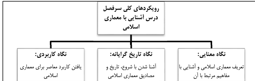
نمودار ۱- رویکردهای کلی سرفصل درس آشنایی با معماری اسلامی

بر مبنای رویکردهای کلی برنامه این درس و با استناد به مؤلفه‌های موجود در سرفصل، سنجه‌های مورد پرسش به دسته‌هایی تقسیم شدند و در هر دسته میزان فهم دانشجویان از مطالب ارائه شده سنجیده شد (نمودار ۲).