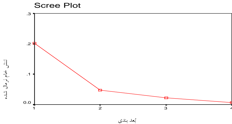
نمودار ۱- نمودار مقدار ویژه

نقاطی که در نمودار ۲ نشان داده شده است، نشان‌دهنده هر یک از رفتارهای تقلب است که با علامت B در فضای دو بُعدی بر اساس فاصله آنها نسبت به یکدیگر آمده است. بُعد اول بر روی محور X و بُعد دوم بر روی محور Y قرار دارد. در این فضا به خوبی می‌توان ساختار دو بُعدی دیدگاه دانشجویان را در خصوص رفتار تقلب مشاهده کرد. در واقع، فاصله بین این نقاط نشان‌دهنده شباهت بین رفتارهاست؛ به عبارتی، دو رفتار مشابه به واسطه دو نقطه‌ای که نزدیک به هم هستند و دو رفتار نامتشابه به واسطه دو نقطه‌ای که از یکدیگر دور هستند، نشان داده شده‌اند. البته، تفسیر این نقاط با توجه به ابعاد بررسی می‌شود. بدین صورت که با توجه به بُعد اول، نقاط مثبتی که در سمت راست محور X قرار دارند، بیشترین شباهت را با یکدیگر دارند و نیز نقاط منفی که در سمت چپ محور X قرار دارند، به یکدیگر شبیه هستند. بنابراین، نقاط سمت راست و سمت چپ محور X شباهت کمتری به یکدیگر دارند. حتی در بین رفتارهایی که در سمت راست محور X قرار دارد، نقاطی که به یکدیگر نزدیک‌ترند، از دیدگاه دانشجویان شباهت بیشتری وجود دارد. بُعد دوم هم همین‌گونه تفسیر می‌شود.